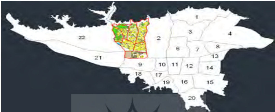
شکل شماره ۱: موقعیت جغرافیایی منطقه ۵ شهر تهران نسبت به منطقه ۲۲ گانه

براساس آخرین سرشماری سال ۸۵، جمعیت منطقه به میزان ۶۷۷,۰۸۵ نفر بوده که برآورد جمعیتی منطقه در سال ۸۶ نیز به میزان ۶۸۵,۳۳۴ نفر در قالب ۲۰۴,۲۱۸ خانوار می‌باشد. این منطقه به ۷ ناحیه تقسیم شده است که مساحتی برابر ۵۲۸۷/۱ هکتار را در بر گرفته که از این حیث پس از مناطق ۲۲ و ۴ بیشترین وسعت را در کل شهر تهران بخود اختصاص داده است (همان منبع).